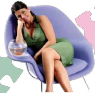
Mercoledì 18 febbraio 2009 GEPPI CUCCIARI in "Si vive una volta. Sola"