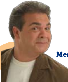
Mercoledì 4 febbraio 2009 FRANCO NERI in "Ma quale lavoro!"