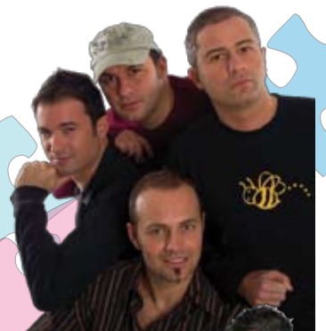
Mercoledì 29 aprile 2009 I TURBOLENTI in "Siamo poveri di mezzi" Speciale ospite della serata GIOVANNI VERNIA