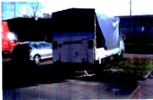
Furgone abbandonato... (è lì da 1 anno)